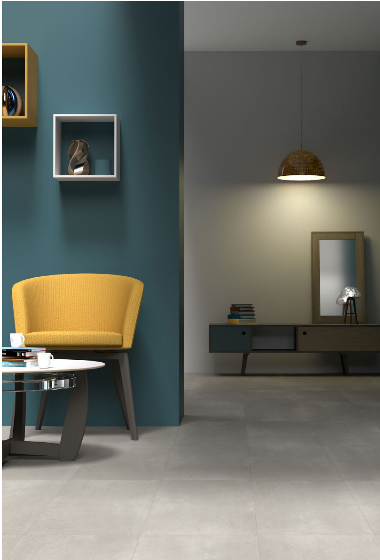
Antare Avana 60x60