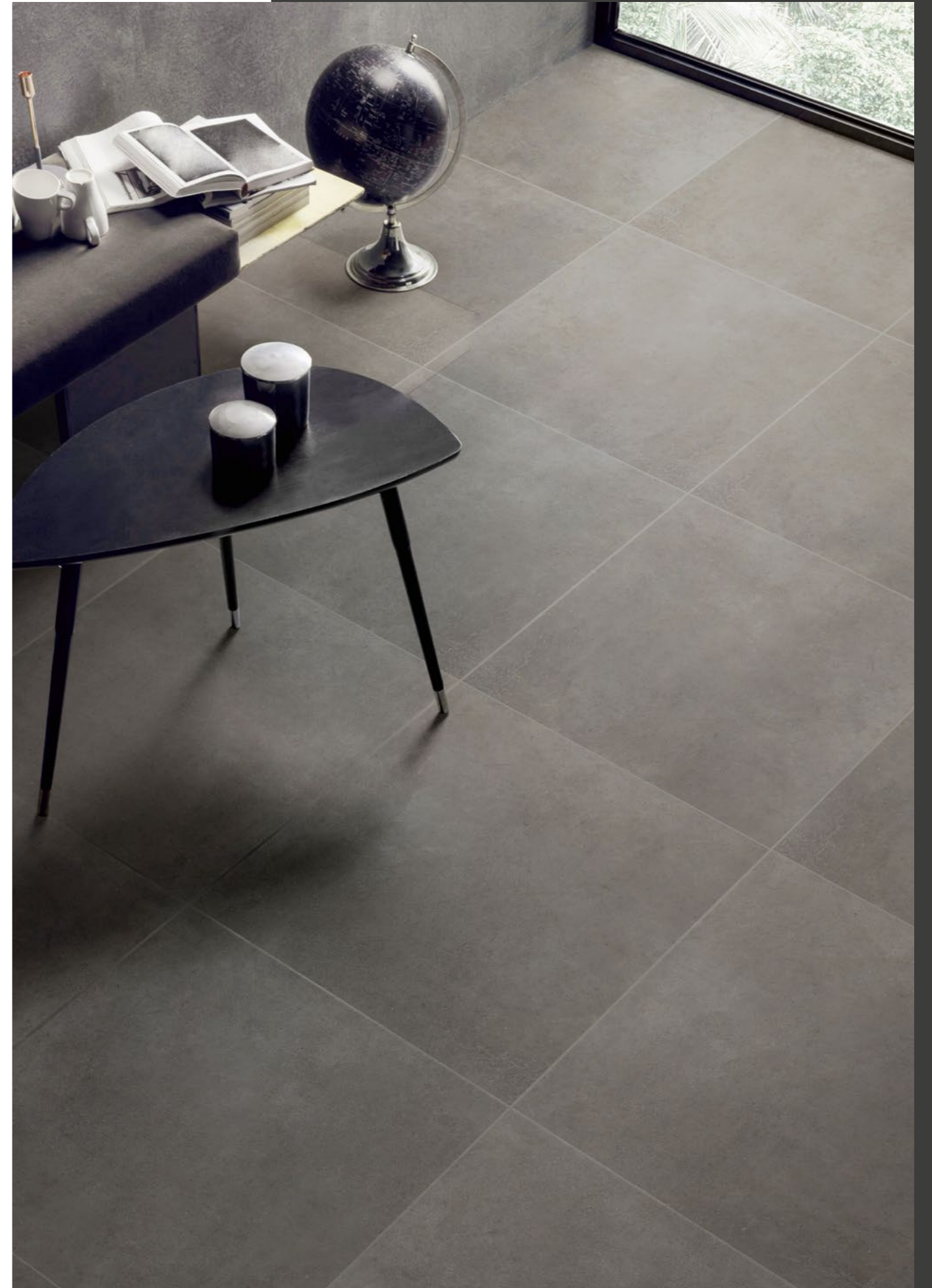
Antare Piombo 60x60