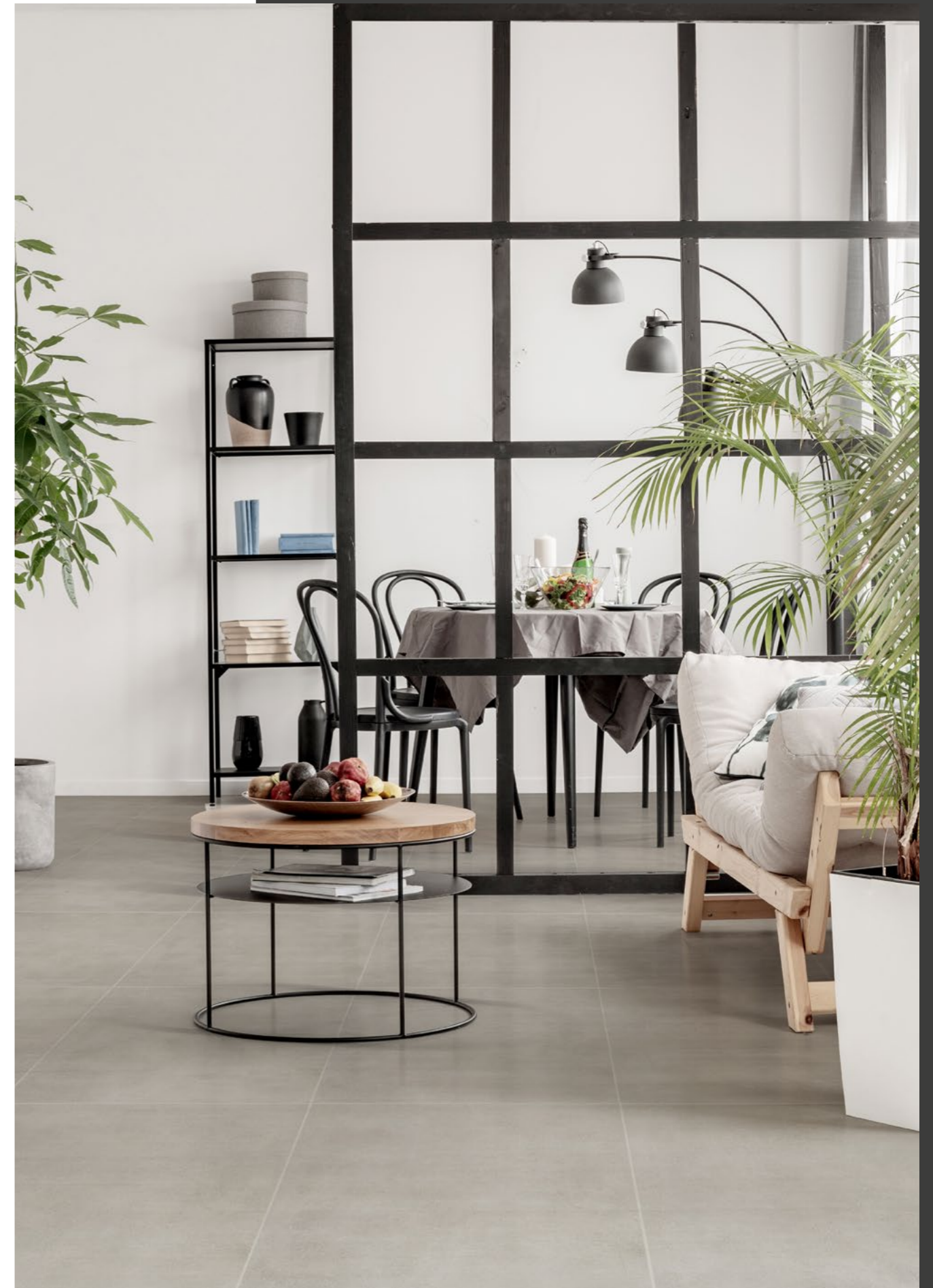
Antares Silver 60x60