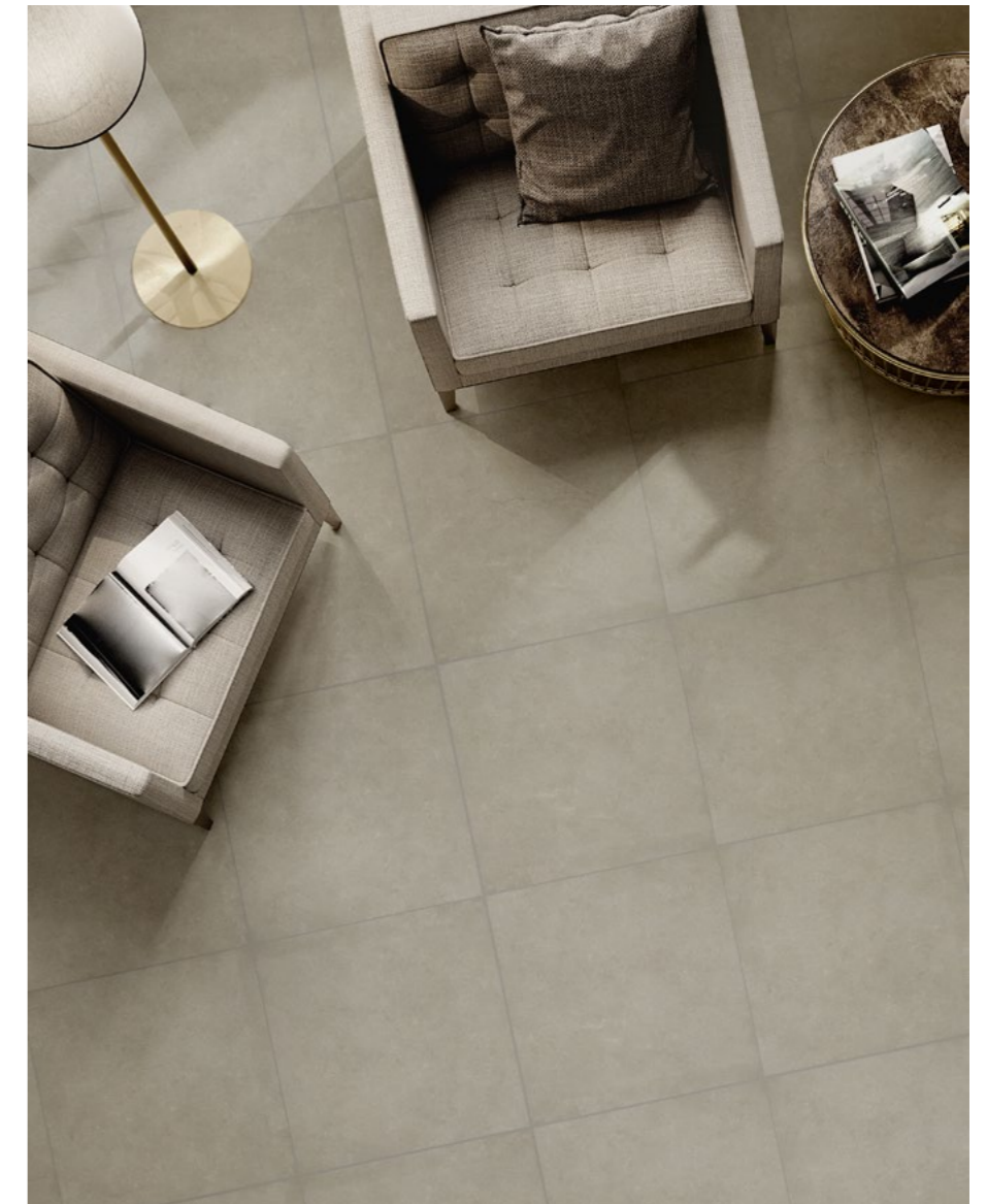
Antares Visone 60x60